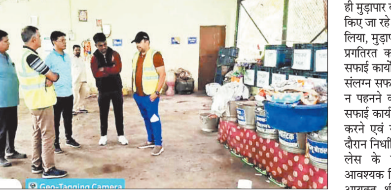
सफाई व्यवस्था का जायजा लेते आयुक्त।

निगम आयुक्त ने स्कूटर पर सवार होकर सहायक कलेक्टर एवं निगम के अधिकारियों की टीम के साथ शहर का दौरा कर साफ-सफाई कार्यों सहित विभिन्न प्रगतिरत विकास कार्यों का निरीक्षण किया। नागरिक सेवाओं व सुविधाओं से जुड़े कार्यों का जायजा लिया, विकास कार्यों की गुणवत्ता को देखा तथा आवश्यक दिशा निर्देश अधिकारियों को दिए। इस दौरान उन्होंने सफाई कार्य में संलग्न स्वच्छता दीवियों व सफाई कामगारों से उनके कार्यों के संबंध में चर्चा की।