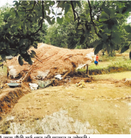
हाथियों द्वारा रौंदी गई धान की फसल व झोपड़ी।

जिले के कोरबा वनमंडल अंतर्गत पसरखेत व कुदमुरा रेंज में मौजूद हाथियों ने खेतों में पहुंचकर जमकर उत्पात मचाना शुरू कर