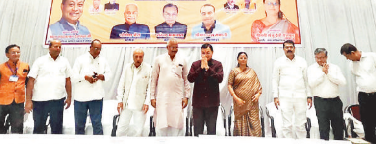
शपथ ग्रहण समारोह में उपस्थित उद्योग मंत्री लखनलाल देवांगन एवं नव नियुक्त पदाधिकारी।