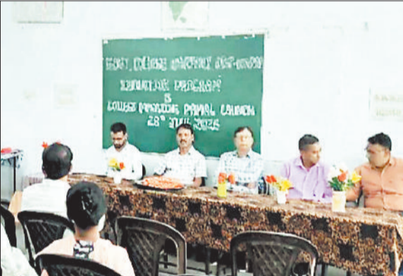
कार्यक्रम में शामिल अतिथि।