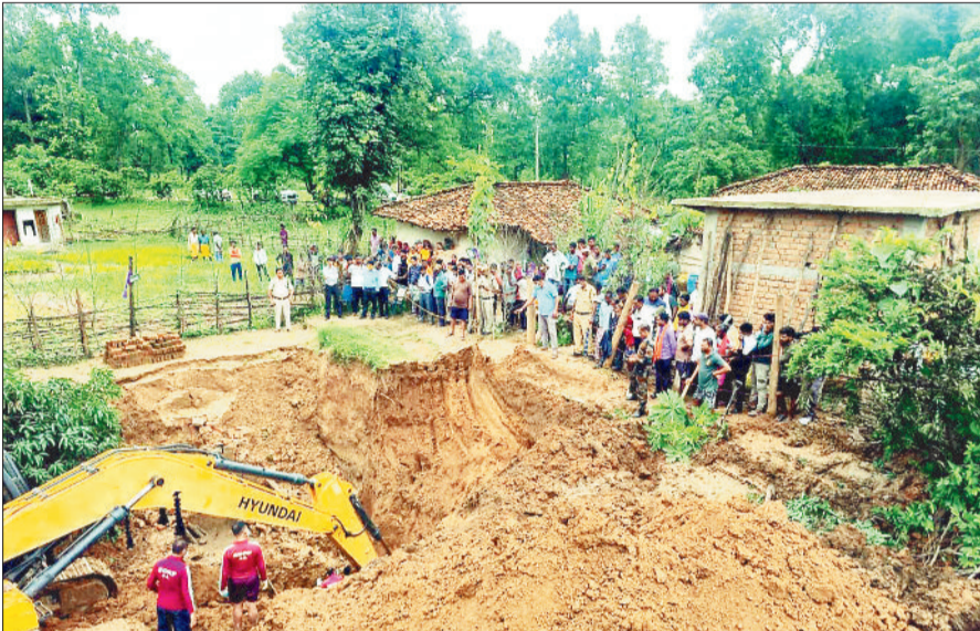
चेन माउंटेन मशीन से रेस्क्यू करते हुए।