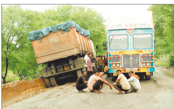
जर्जर सड़क में फंसे वाहन।

रात दो ट्रक गहरे गड्डों में धंस गए। इस वजह से घंटों तक यातायात प्रभावित रहा और राहगीरों के साथ वाहन चालकों को भारी परेशानी उठानी पड़ी।