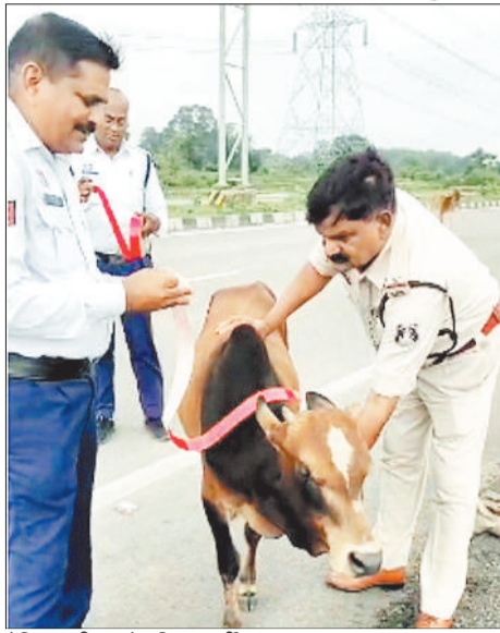
रेडियमपट्टी बांधते पुलिस कर्मी।