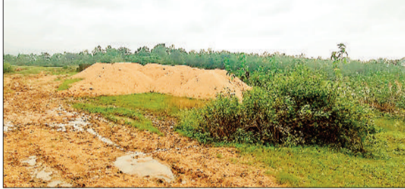
रेत का अवैध भंडारण।

तरह नगोई क्षेत्र में अज्ञात व्यक्तियों द्वारा करीब 7 सौ घन मीटर रेत डंप करके रखा गया था, जिसे जब्त करते हुए खनिज नियमों के अंतर्गत कार्रवाई की जा रही है। रेत माफियाओं के खिलाफ पिछले पंद्रह दिनों से रुकी कार्रवाई खनिज विभाग द्वारा एक बार फिर से प्रारंभ कर दी गई है। इसके अंतर्गत खनिज अमले द्वारा रतनपुर, जोगीपुर, कोटा, बेलगहना, सोनपुरी, नगोई, खोगसरा, आमगोहन क्षेत्र का