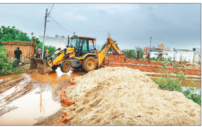
अतिक्रमण तोड़ते नगर निगम का जेसीबी।