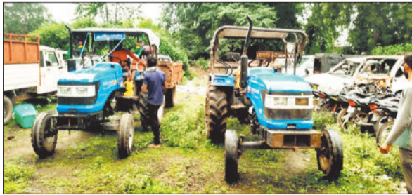
जब्त किए गए ट्रेक्टर।

निरिक्षण किया गया था। इसके अंतर्गत जोगीपुर क्षेत्र से रेत का अवैध रूप से खनन कर परिवहन करते पाये गए 02 ट्रेक्टर वाहनों को जब्त कर पुलिस थाना रतनपुर की अभिरक्षा में रखा गया है।