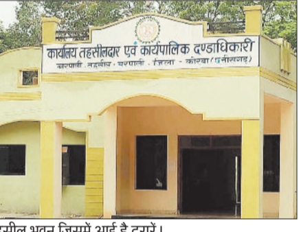
नया तहसील भवन जिसमें आई है दरारें।

ग्राम पंचायत बरपाली में स्थित नवीन तहसील भवन के निर्माण में भारी अनियमितता देखने को मिल रही है। निर्माण एजेंसी द्वारा घटिया निर्माण किया गया है जो अब दिखने लगा है। दीवारों पर पड़ी दरारें निर्माण एजेंसी व ठेकेदार की लापरवाही को उजागर कर रही है। तहसील कार्यालय को संचालित होते अभी एक माह भी नहीं हुआ कि घटिया निर्माण की पोल खुलने लगी। भवन के दीवारों में जगह जगह दरारें पड़ गयी हैं। कई जगह छोटी छोटी दरारों को बाहर से पट्टी लगाकर छुपाने की कोशिश हुई है, किंतु बड़े दरार घटिया स्तर के निर्माण को उजागर कर रहे हैं।