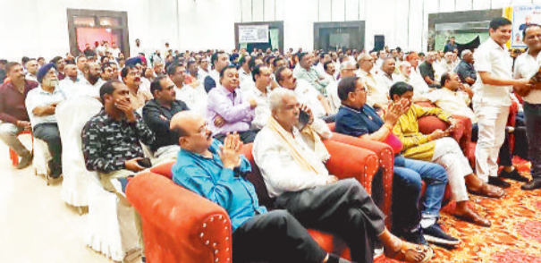
कार्यक्रम में उपस्थित व्यापारी।